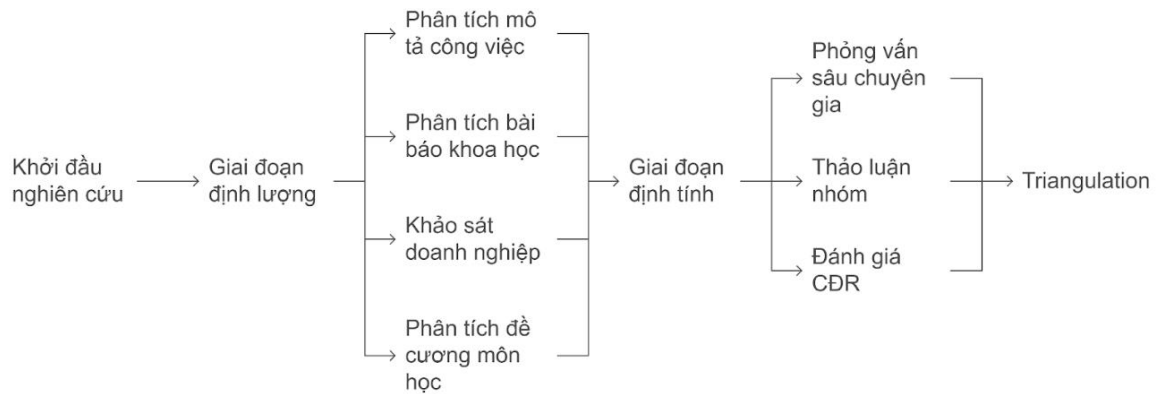
Hình 1. Thiết kế nghiên cứu phương pháp hỗn hợp.